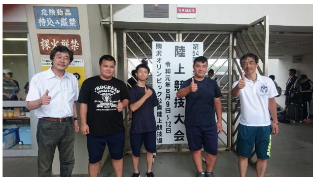
駒沢オリンピック公園陸上競技場にて