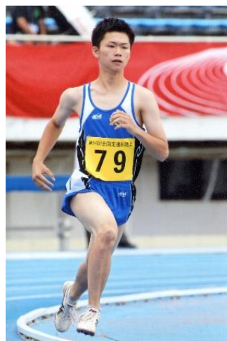
日頃の練習の成果を発揮した見事な走りでした。