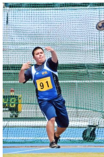
貴重な経験を積むことができました

茨城県代表として、昼間制陸上競技部より3名の生徒が出場しました。茨城県チームのため、自分自身の目標達成のため、全国の強豪たちに挑みました。日頃の練習の成果を発揮し、試合を楽しむことができました。【結果：男子 400 m 走, 円盤投出場】