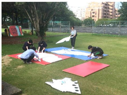
前回の材料を再利用